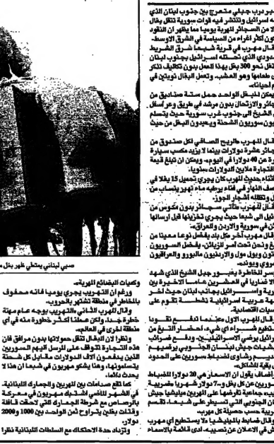
شيعة (بناين) من كرم الله ضامر

مصدر جوي في مخيم جنوبي لبنان، حيث يقول إن تجارة التهرب بالنغال نشطة في جنوب لبنان المحتل وسورية. وهو يصف التهرب بالنغال بأنه "تجارة خطيرة" حيث يتم تهريب البضائع من سورية الى لبنان، ومن لبنان الى سورية، ومن لبنان الى فلسطين، ومن فلسطين الى لبنان.